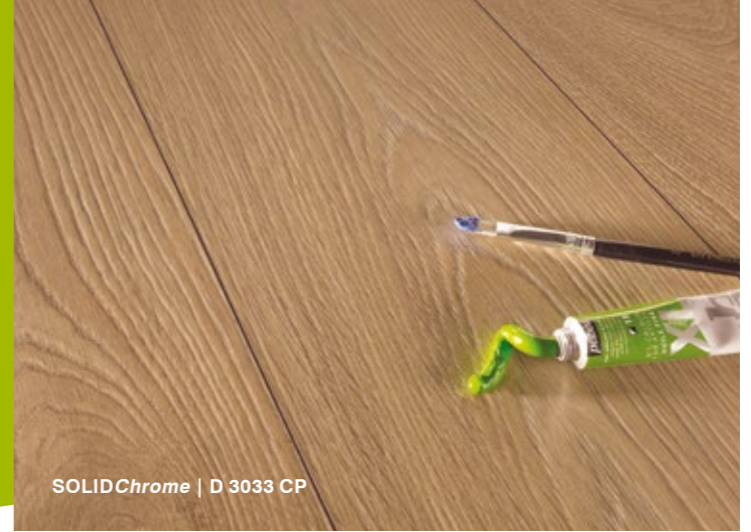
SOLIDChrome | D 3033 CP

Abbiamo scelto per voi questa linea di pavimenti di alta qualità, composta da tavole bisellate sui 4 lati e spessore 12mm . La resistenza è garantita dall'elevato spessore oltre che dalla classe di usura massima. La finitura sincronizzata mette in luce tutta la bellezza del rovere.