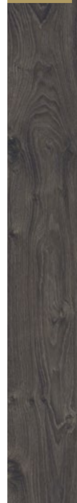
D 3030 CP

Rovere Arosa battiscopa: D 3030 profilo: legno 95