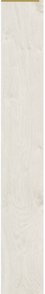
D 4202 CP

Rovere Interlaken battiscopa: D 701 profilo: legno 13