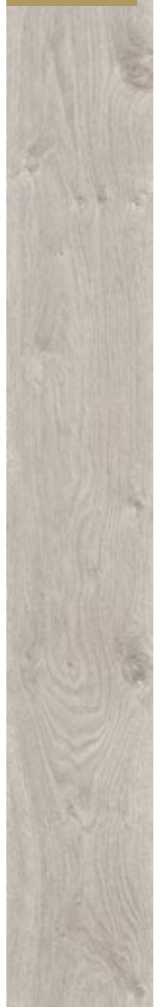
D 3034 CP

Rovere Engelberg battiscopa: D 3034 profilo: legno 13