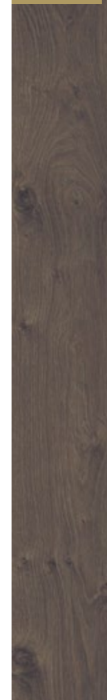
D 2025 CP

Rovere Leysin battiscopa: D 2025 profilo: legno 78