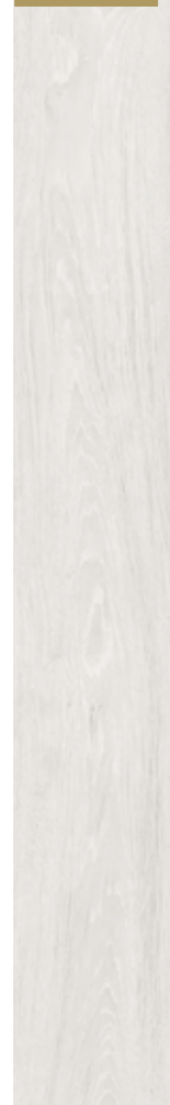
D 3035 CP

Rovere Davos battiscopa: D 2745 profilo: legno 09