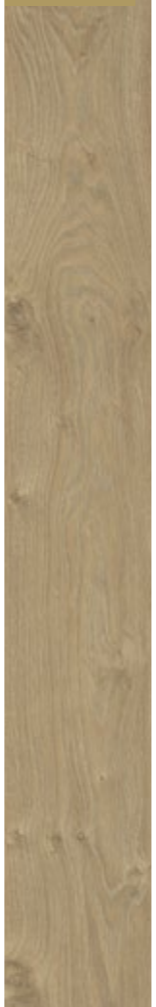
D 3033 CP

Rovere Zermatt battiscopa: D 742 profilo: legno 40